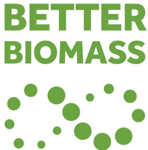
Figuur F.3 — 'Better Biomass'-logo voor niet-certificaathouders

Het 'Better Biomass'-logo dat door een organisatie anders dan een certificaathouder onder voorwaarden mag worden gebruikt is weergegeven in figuur F.3.